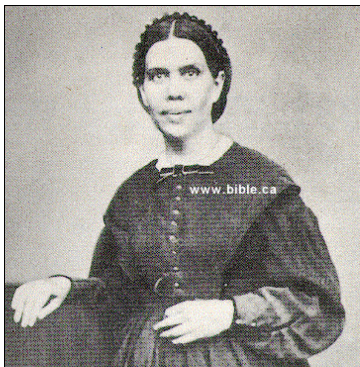
prorokyně církve ostatků Ellen Whiteová

její rady. Její hyperetické požadavky zahrnovaly zákazy dětem hrát si v sobotu, nošení jistých druhů oděvu a odsouzení tenisu, košíkové, kriketu a jízdy na bicyklu. Takové charakteristiky jejího myšlení a mínění lze pravděpodobně přičíst následkům z jejího zranění.... 177